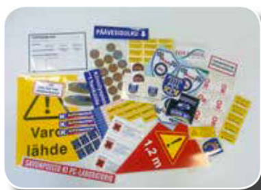
Erimuotoisia, -värisiä ja -kokoisia irtileikattuja tarroja.