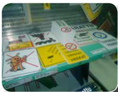
Meillä on hyllyssä valmiina kymmeniä erilaisia tarroja ja kilpiä.

Valmistamme erilaisia tarroja monipuolisilla koneillamme. Tarran koko, väri, muoto ja määrä vapaa. Pienet ja suuret määrät. Myös esim. juokseva numerointi. Sisä- ja ulkokäyttöön. Suojalaminointi lisää tarran kulutuskestävyyttä. Voimme liimata tarrat erilaisille pohjamateriaaleille esim. muovi ja alumiini. Meillä on tiedostoissa satoja valmiita turvakilpi malleja.